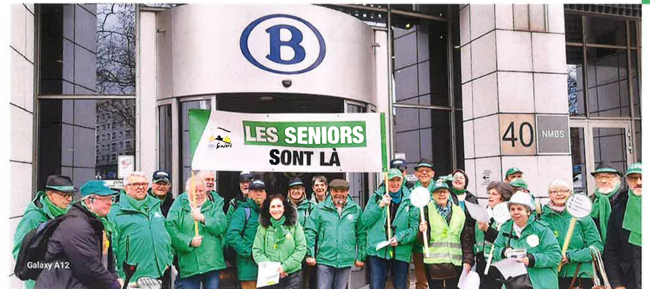
Action des Seniors CSC au siège d'Infrabel à Bruxelles le 15 mars